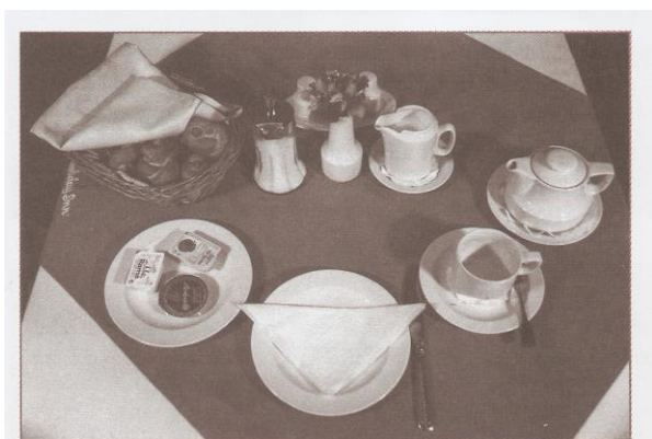
Prostředí stolu s jednoduchou snídaní